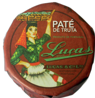
PATÉ DE TRUCHA EAN13: 5602899281413