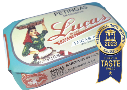
“PETINGAS” SARDINILLAS EN MARINADA EAN13: 5602899213278