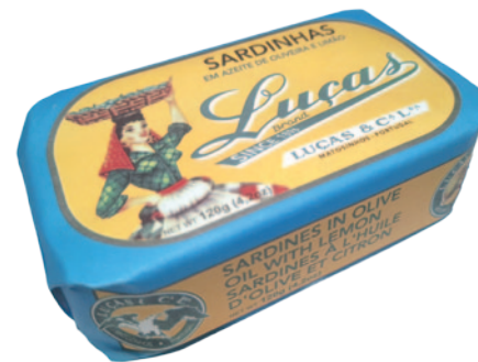
SARDINAS PORTUGUESAS EN ACEITE D'OLIVA Y LIMÓN EAN13: 5602899211151