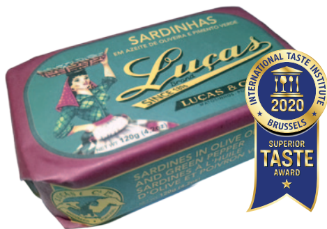
SARDINAS PORTUGUESAS EN ACEITE D'OLIVA Y PIMIENTO VERDE EAN13: 5602899211168