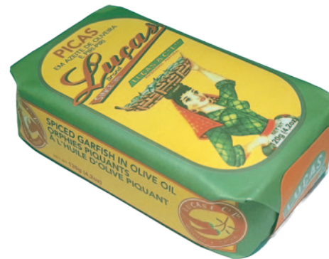
“PICAS” EN ACEITE D’OLIVA Y PIRI-PIRI EAN13: 5602899300121