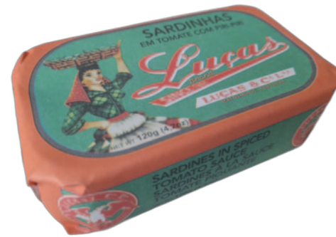
SARDINAS PORTUGUESAS EN TOMATE Y PIRI-PIRI EAN13: 5602899211236