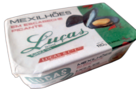
MEJILLONES EN SALSA ESCABECHE PICANTE EAN13: 5602899410721