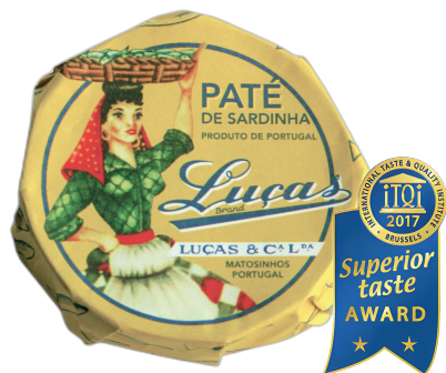
PATÉ DE SARDINA EAN13: 5602899211410