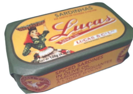
SARDINAS PORTUGUESAS EN ACEITE D'OLIVA Y PIRI-PIRI EAN13: 5602899211120