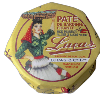
PATÉ DE SARDINA PICANTE EAN13: 5602899211427