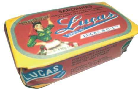
SARDINAS PORTUGUEZAS SIN PIEL Y SIN ESPINA EN ACEITE D'OLIVA Y TOMATE EAN13: 5602899211199