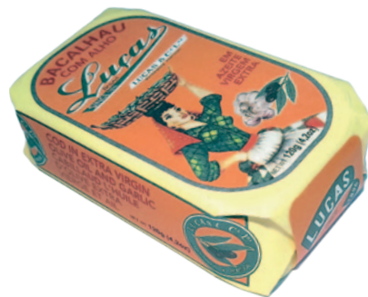
BACALAO EN ACEITE D'OLIVA Y AJO EAN13: 5602899271100