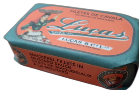
FILETES DE CABALLA EN SALSA DE MOSTAZA EAN13: 5602899221297