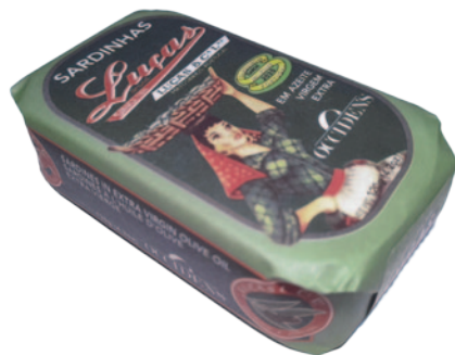
SARDINAS PORTUGUESAS "MILLÉSIME 2020" EN ACEITE D'OLIVA EXTRA VIRGEN "OCCIDENS" EAN13: 5602899211502