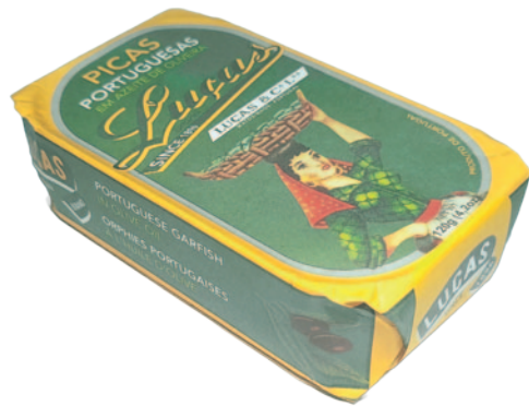
“PICAS” EN ACEITE D’OLIVA EAN13: 5602899300107