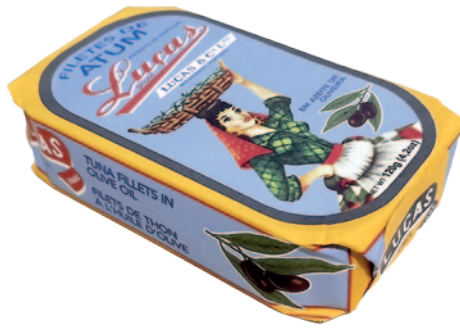
FILETES DE ATÚN EN ACEITE D'OLIVA EAN13: 5602899251188