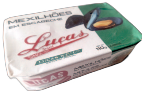
MEJILLONES EN SALSA ESCABECHE EAN13: 5602899410707