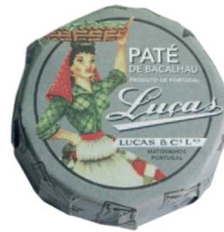
PATÉ DE BACALAO EAN13: 5602899251414