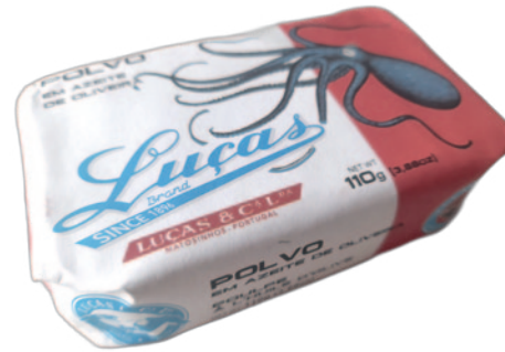
PULPO EN ACEITE D'OLIVA EAN13: 5602899241103