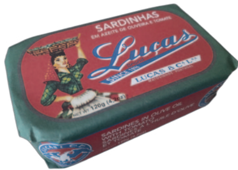
SARDINAS PORTUGUESAS EN ACEITE D'OLIVA Y TOMATE EAN13: 5602899211113