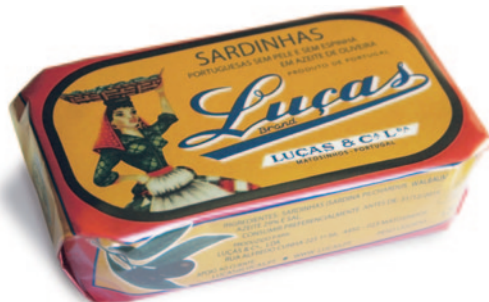
SARDINAS PORTUGUEZAS SIN PIEL Y SIN ESPINA EN ACEITE D'OLIVA EAN13: 5602899211182