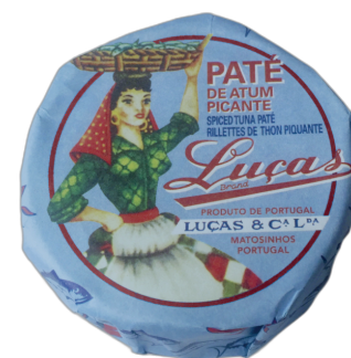
PATÉ DE ATÚN PICANTE EAN13: 5602899251423