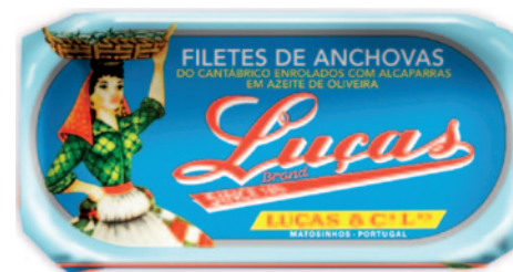
FILETES DE ANCHOAS DEL CANTÁBRICO ENVUELTOS CON ALCAPARRAS EN ACEITE D'OLIVA