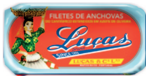
FILETES DE ANCHOAS DEL CANTÁBRICO EXTENDIDOS EN ACEITE D'OLIVA