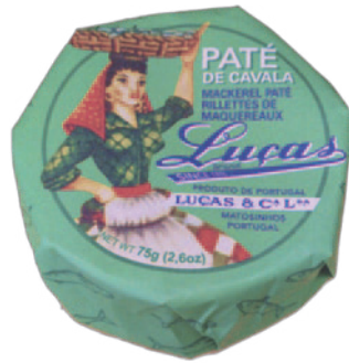
PATÉ DE CABALLA EAN13: 5602899221419