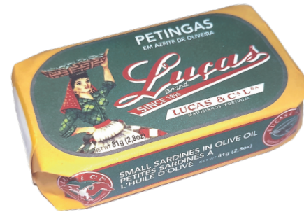
“PETINGAS” SARDINILLAS EN ACEITE D'OLIVA EAN13: 5602899212103