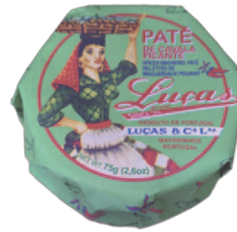
PATÉ DE CABALLA PICANTE EAN13: 5602899221428