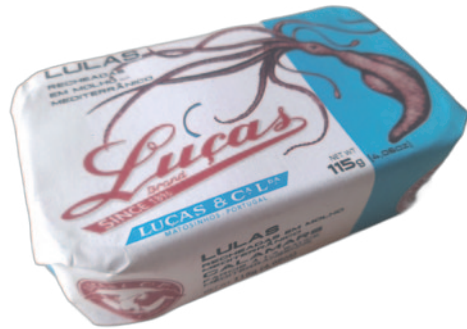
CHIPIRONES RELENOS EN SALSA MEDITERRÁNEA EAN13: 5602899231272