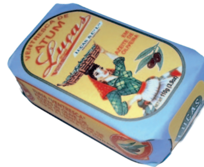
VENTRESCA DE ATÚN EN ACEITE D'OLIVA EAN13: 5602899251195