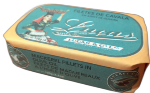
FILETES DE CABALLA EN ACEITE D'OLIVA EAN13: 5602899221105