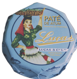
PATÉ DE ATÚN EAN13: 5602899251416