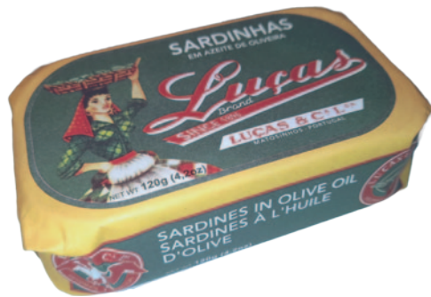
SARDINAS PORTUGUESAS EN ACEITE D'OLIVA EAN13: 5602899211106