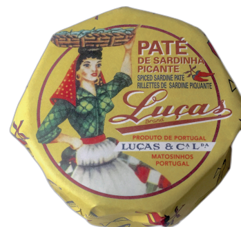
PATÊ DE SARDINHA PICANTE EAN13: 5602899211427