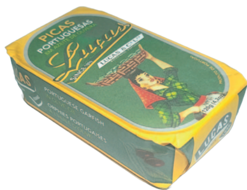
PICAS EM AZEITE DE OLIVEIRA EAN13: 5602899300107