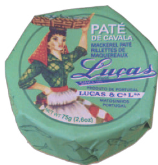
PATÊ DE CAVALA EAN13: 5602899221419