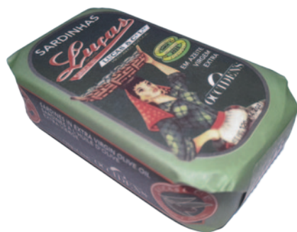
SARDINHAS PORTUGUESAS "MILLÉSIME 2020" EM AZEITE DE OLIVEIRA EXTRA VIRGEM "OCCIDENS" EAN13: 5602899211502