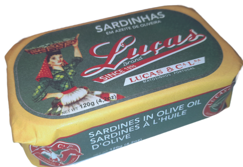
SARDINHAS PORTUGUESAS EM AZEITE DE OLIVEIRA EAN13: 5602899211106