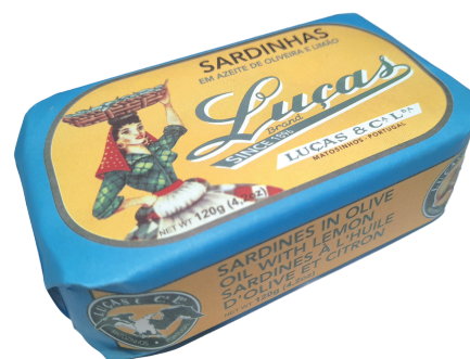
SARDINHAS PORTUGUESAS EM AZEITE DE OLIVEIRA E LIMÃO EAN13: 5602899211151