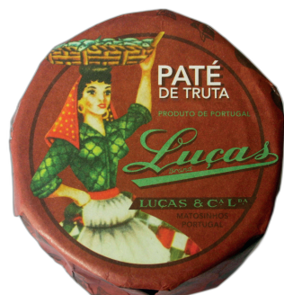
PATÊ DE TRUTA EAN13: 5602899281413