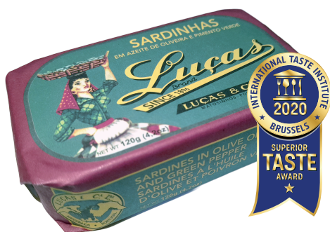
SARDINHAS PORTUGUESAS EM AZEITE DE OLIVEIRA E PIMENTO VERDE EAN13: 5602899211168