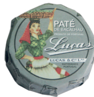
PATÊ DE BACALHAU EAN13: 5602899251414