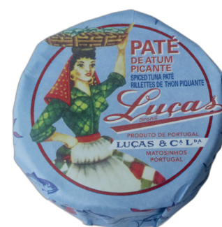
PATÊ DE ATUM PICANTE EAN13: 5602899251423