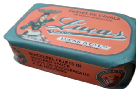
FILETES DE CAVALA EM MOLHO DE MOSTARDA EAN13: 5602899221297