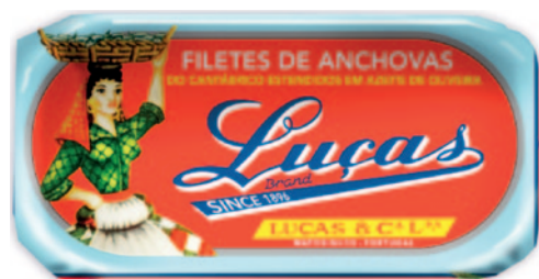
FILETES DE ANCHOVAS DO CANTÁBRICO ESTENDIDOS EM AZEITE DE OLIVEIRA