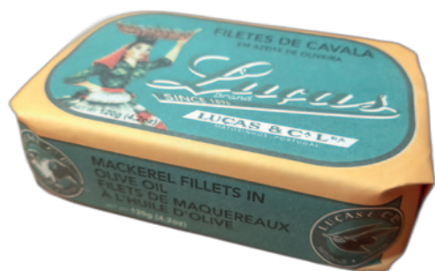
FILETES DE CAVALA EM AZEITE DE OLIVEIRA EAN13: 5602899221105