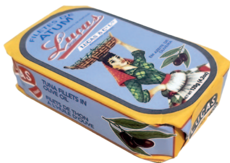
FILETES DE ATUM EM AZEITE DE OLIVEIRA EAN13: 5602899251188