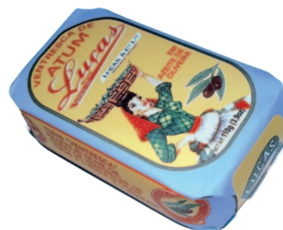
VENTRESCA DE ATUM EM AZEITE DE OLIVEIRA EAN13: 5602899251195