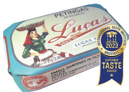
PETINGAS EM ESCABECHE EAN13: 5602899213278