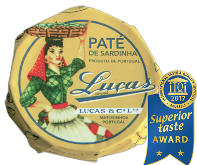
PATÊ DE SARDINHA EAN13: 5602899211410