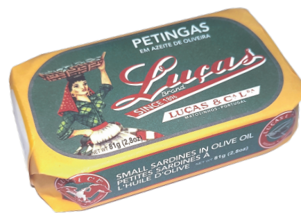
PETINGAS EM AZEITE DE OLIVEIRA EAN13: 5602899212103