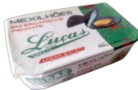
MEXILHÕES EM ESCABECHE PICANTE