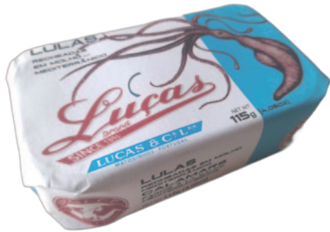
LULAS RECHEADAS EM MOLHO MEDITERRÂNICO