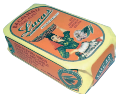
BACALHAU EM AZEITE DE OLIVEIRA E ALHO EAN13: 5602899271100