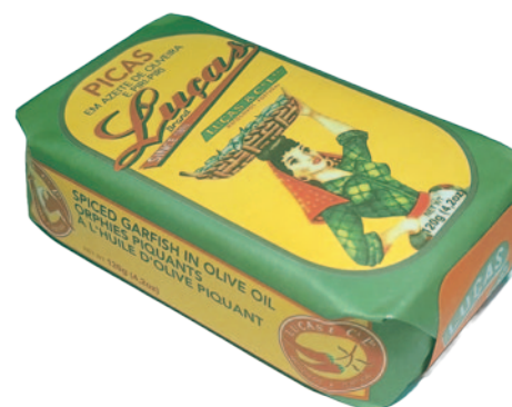
PICAS EM AZEITE DE OLIVEIRA E PIRI-PIRI EAN13: 5602899300121