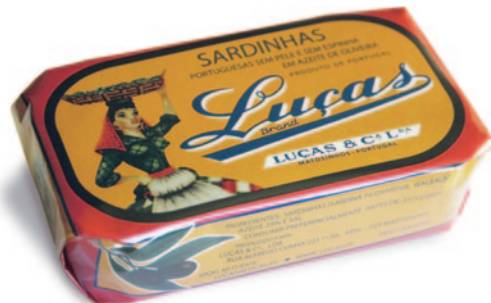
SARDINHAS PORTUGUESAS SEM PELE E SEM ESPINHA EM AZEITE DE OLIVEIRA EAN13: 5602899211182