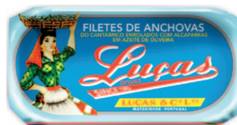
FILETES DE ANCHOVAS DO CANTÁBRICO ENROLADOS EM ALCAPARRAS EM AZEITE DE OLIVEIRA