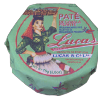
PATÊ DE CAVALA PICANTE EAN13: 5602899221428