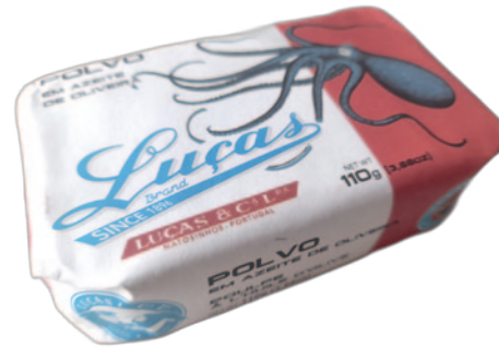
POLVO EM AZEITE DE OLIVEIRA