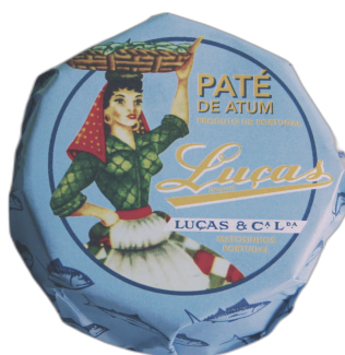
PATÊ DE ATUM EAN13: 5602899251416