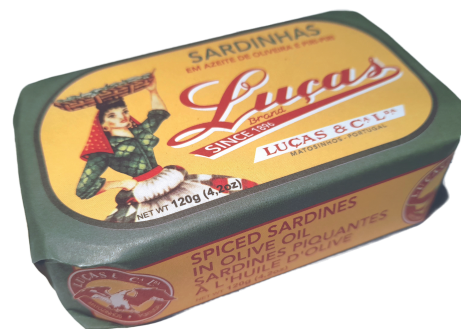
SARDINHAS PORTUGUESAS EM AZEITE DE OLIVEIRA E PIRI-PIRI EAN13: 5602899211120