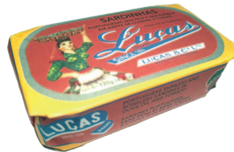
SARDINHAS PORTUGUESAS SEM PELE E SEM ESPINHA EM AZEITE DE OLIVEIRA E TOMATE EAN13: 5602899211199