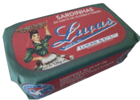
SARDINHAS PORTUGUESAS EM AZEITE DE OLIVEIRA E TOMATE EAN13: 5602899211113