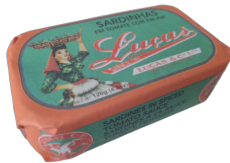
SARDINHAS PORTUGUESAS EM TOMATE E PIRI-PIRI EAN13: 5602899211236