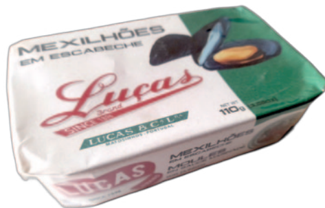
MEXILHÕES EM ESCABECHE